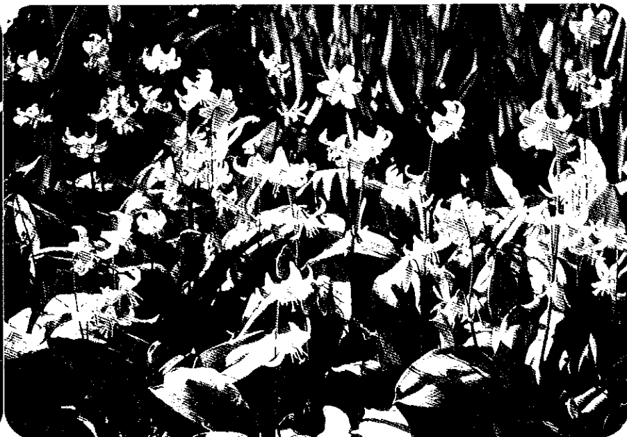
Fritillaria glauca 'Goldilocks' en Erythronium revolutum 'Pagoda' vinden hun oorsprong in de Verenigde Staten