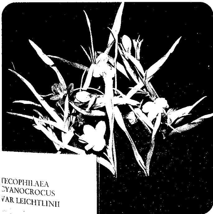
TECOPHILAEA CYANOCROCUS VAR LEICHTLINII

Tecophilaea cyanocrocus var. Leichtlinii komt oorspronkelijk uit Chili