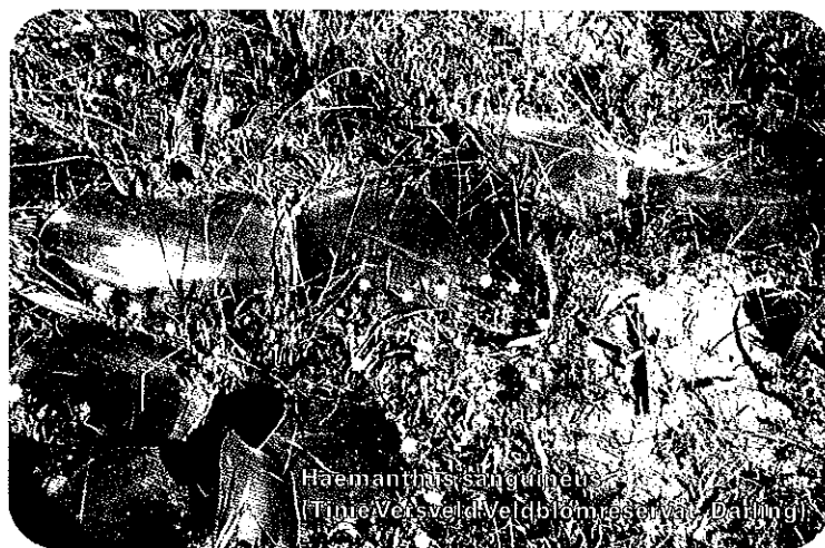
Haemanthus sanguineus (Tinie Versveld blomreservaat Darling)

den op het Noordelijk Halfrond gerekend tot de wintergroeiers. Het zijn behalve H. albiflos niet de makkelijkste planten om in bloei te krijgen, als wordt uitgegaan van in Nederland gekweekt materiaal. Blijft over het kijken naar de bladeren. Diverse soorten hebben fraaie bladeren. Bijvoorbeeld H. pubescens met zijn lange, bruin gekleurde haren die op de bladranden staan, maar ook H. unifolius . Deze plant vormt één succulent blad waarvan de bladrand is bezet met vele, korte haartjes. Verder is de bladrand paars van kleur. Daarnaast kennen diverse soorten een vergelijkbare bladtekening, waarbij het onderste deel van de bladeren aan de buitenzijde een paarse tekening heeft. Deze tekening loopt uiteen van vlekken tot een lijnenpatroon dat over de gehele breedte van het blad loopt. In Nederland zijn sommige gewassen moeilijker te kweken dan in het land van herkomst. Dat geldt bijvoorbeeld voor