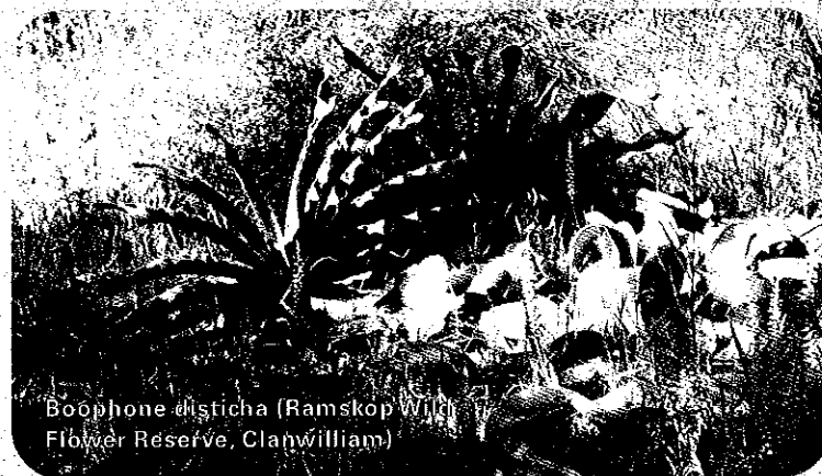
Boophone disticha (Ramskop Wild Flower Reserve, Clanwilliam)