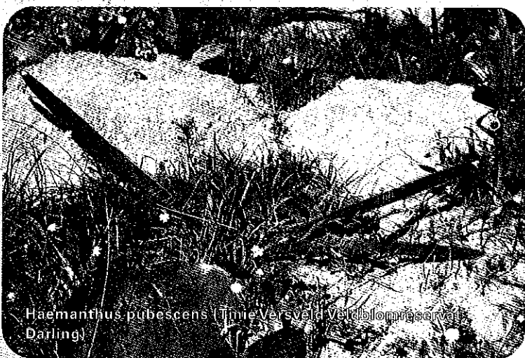
Haemanthus pubescens (Tinie Versveld blomreservaat Darling)