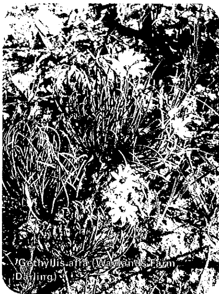
Gethyllis affinis (Wawandis Farm Darling)