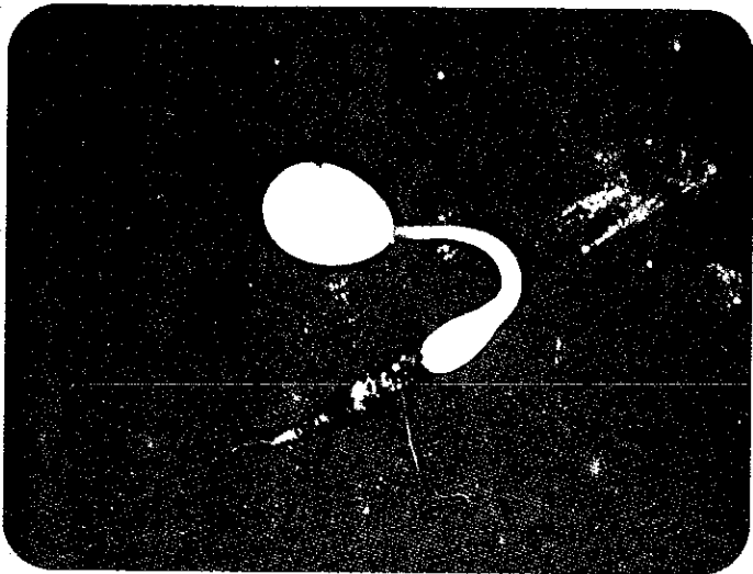
Gekiemd zaad van Haemanthus albiflos