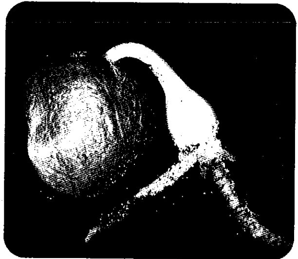
Gekiemd zaad van Crinum powellii