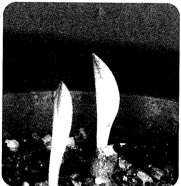
Gekiemd zaad van Veltheimia bracteata