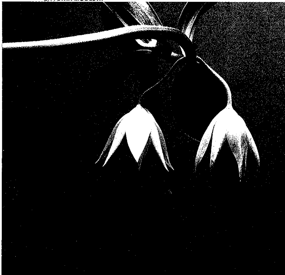
BLOEIENDE PLANT LITTONIA MODESTA

Wat betreft het kweken stellen de drie planten dezelfde eisen. De knollen van november/april droog bewaren bij 5-15 °C. Verstandig is om de knollen los te bewaren, en niet in een droog medium. Dit om vroegtijdig uitlopen te voorkomen. De knollen april/begin mei planten in een diepe pot. Plant de knol net onder het grondoppervlak, horizontaal, met het groeipunt naar beneden. De reden hiervoor is dat de plant vanuit het groeipunt een nieuwe knol vormt, die naar beneden groeit. Alledrie de klimmers zijn warmteliefhebbers. Het beste is ze op een zonnige plek vlak voor het raam of in de kas te zetten, maar niet buiten. Afhankelijk van het plantmoment en start van de groei bloeien ze tussen begin juli en half september. De ervaring is dat Gloriosa superba en Littonia modesta zelfertiel zijn en vrij makkelijk zaad vormen. Het gevormde zaad na oogsten droog bewaren tot volgend voorjaar en dan zaaien. Het