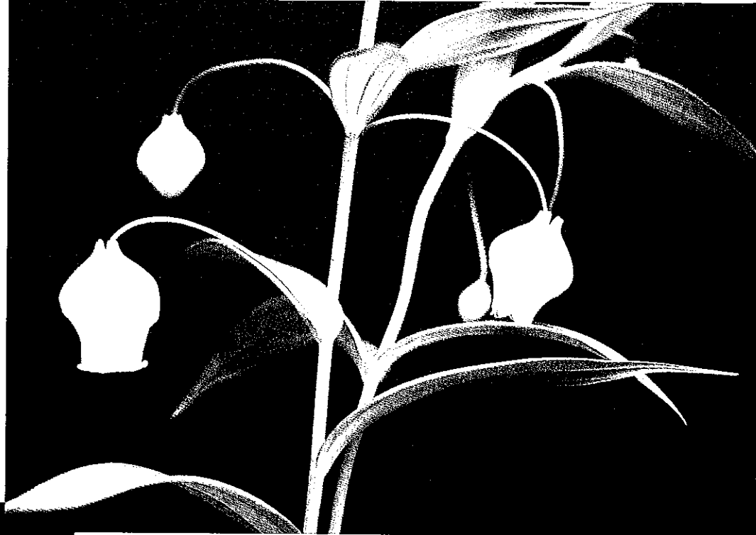
BLOEM GLORIOSA SUPERBA