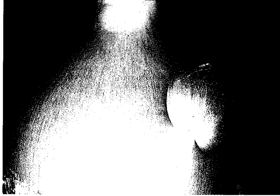
ORNITHOGALUM LONGIBRACTEATUM, MOEDER- EN DOCHTERBOL

consumenten: zo'n 4 tot 6,5 euro. Tot zo'n acht jaar geleden had ik succulenten, daarna heb ik me volledig op de bollen gestort. Naast cactussen of vetplanten hadden diverse amateurkwekers ook wel wat rotsplanten en bolletjes. Bij de meeste mensen hoefde je niet aan te komen met deze Ornithogalum. Ze hadden hem al, of ze waren blij 'm net kwijt te zijn. Sommigen noemden het onkruid. De plant is erg makkelijk te kweken, groeit en bloeit goed, vormt makkelijk zaad en zijbollen. Is deze prijs dan nog redelijk? Typisch voor O. longibracteatum is dat op de bol zijbollen groeien, niet aan de onderzijde, maar op de 'zijkant van de plant'.