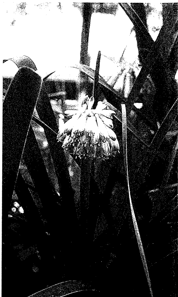
Boven: Clivia nobilis Onder: Uitzicht op Kaapstad vanuit de tuin