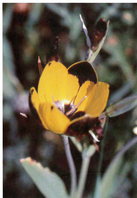
Hesperantha vaginata bloeit bij Neil MacGregor nog volop, maar is elders zeer zeldzaam

In augustus 2004 hielp de IBSA in het voortbestaan van Haemanthus lanceifolia in de nabijheid van Vanrhynsdorp. Een locale boer had het plan opgevat om een stuk grond om te ploegen waar sprake was van een levensvatbare populatie van dit soort: het was één van de twee bekende groeiplaatsen van dit soort. De IBSA heeft met de boer onderhandeld en er is overeenstemming bereikt om een reservaat te creëren gelegen in de wijngaard. Alsof er nog niet genoeg druiven worden verbouwd, er is al jaren een enorm overschot aan wijn, maar dat daar gelaten. Planten die buiten het beschermde stuk staan, worden opgerooid en binnen het gebied geplant. Of dit een voor de toekomst realistische en duurzame oplossing is, zal de tijd moeten leren.