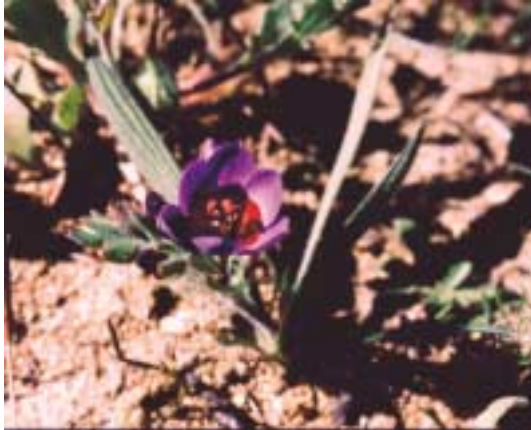
Babiana rubrocyanea (Waylands Farm)

De eerste stop is het net ten noorden van Darling gelegen Tinie Versveld Wild Flower Reserve, of wel op z'n Afrikaans: 'het Veldblommenreservaat'. Vanaf de weg is duidelijk te zien, dat er het een en ander bloeit. Direct vallen de witbloeiende planten van Zantedeschia aethiopica en de oranjebloeiende Romulea tortuosa ssp. tortuosa op. Er blijken vrij veel bolgewassen in bloei te staan, waaronder Romulea tubularis , Lapeirousia jacquinii en Babiana sp.. Verder groeien er diverse Haemanthus -soorten, waarvan alleen de bladeren te zien zijn: H. coccineus , H. pubescens en H. sanguineus .