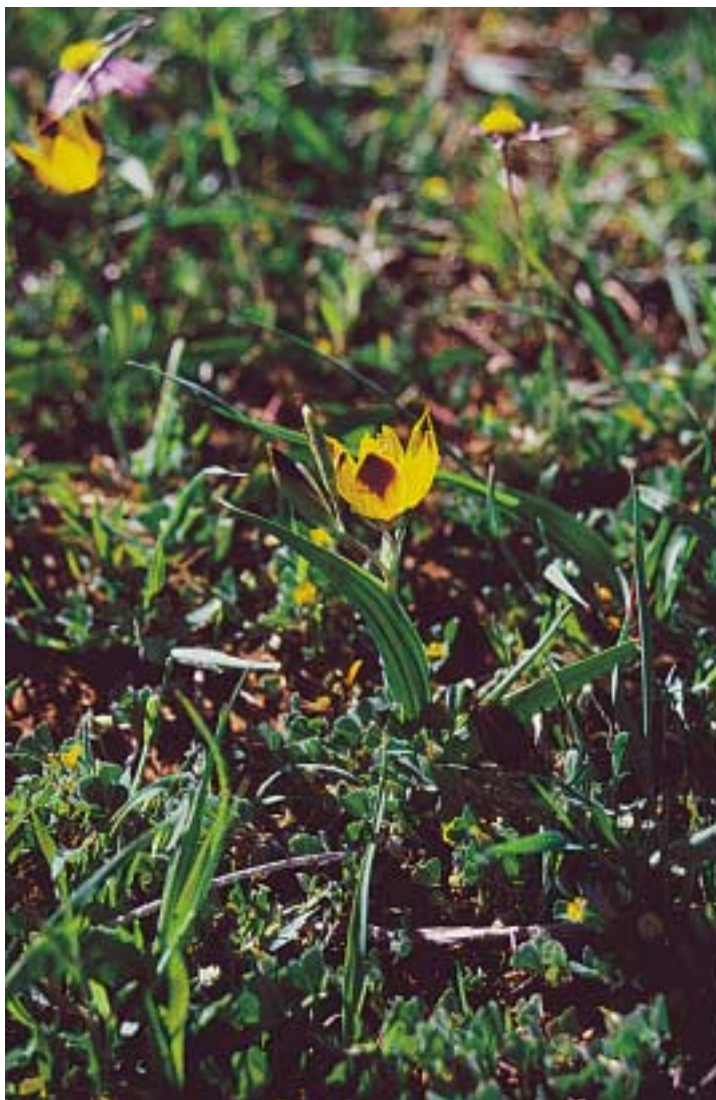
Hesperantha vaginata (Farm Glenlyon, Nieuwoudtville)