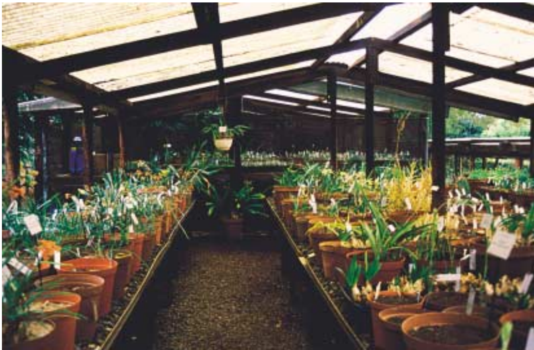
Kirstenbosch Botanical Gardens, deel van de collectie wintergroeiende bolgewassen

Een klein deel van de botanische tuin is aangelegd als park met diverse themabeplantingen: cycaden, fynbos, erica's, protea's, succulenten, rotsplanten, etc. Als je dit alles ziet, dan realiseer je je pas hoe rijk