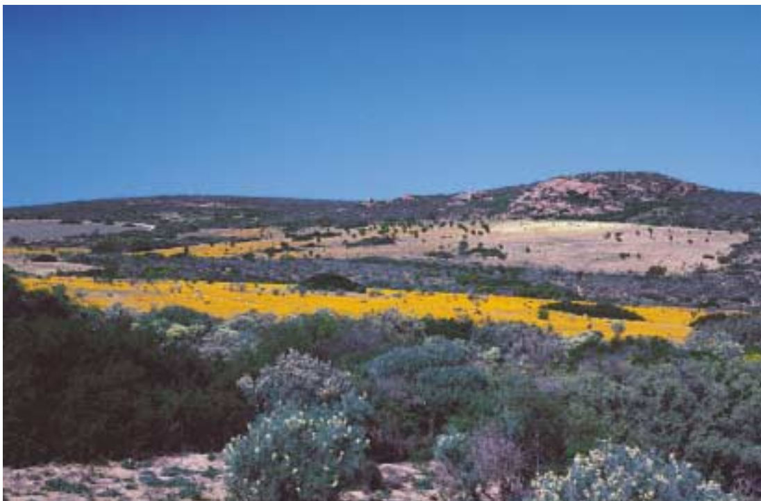
Namaqua National Park 'Skilpad': bloeiende vlaktes met Dimorphoteca sinuata en Grielum humifusum