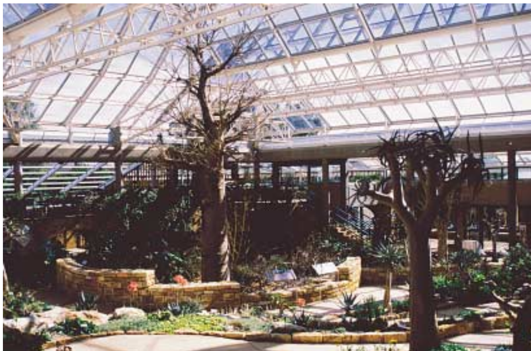
Kirstenbosch Botanical Gardens, Conservatory

Eerst een stukje geschiedenis over deze bijzondere botanische tuin. Het 'geboortetejaar' van Kirstenbosch is 1902. In dat jaar overleed Cecil John Rhodes, die de grond, waarop de botanische tuin later is aangelegd, in 1895 had aangekocht en had bepaald dat de tuin een publieke functie