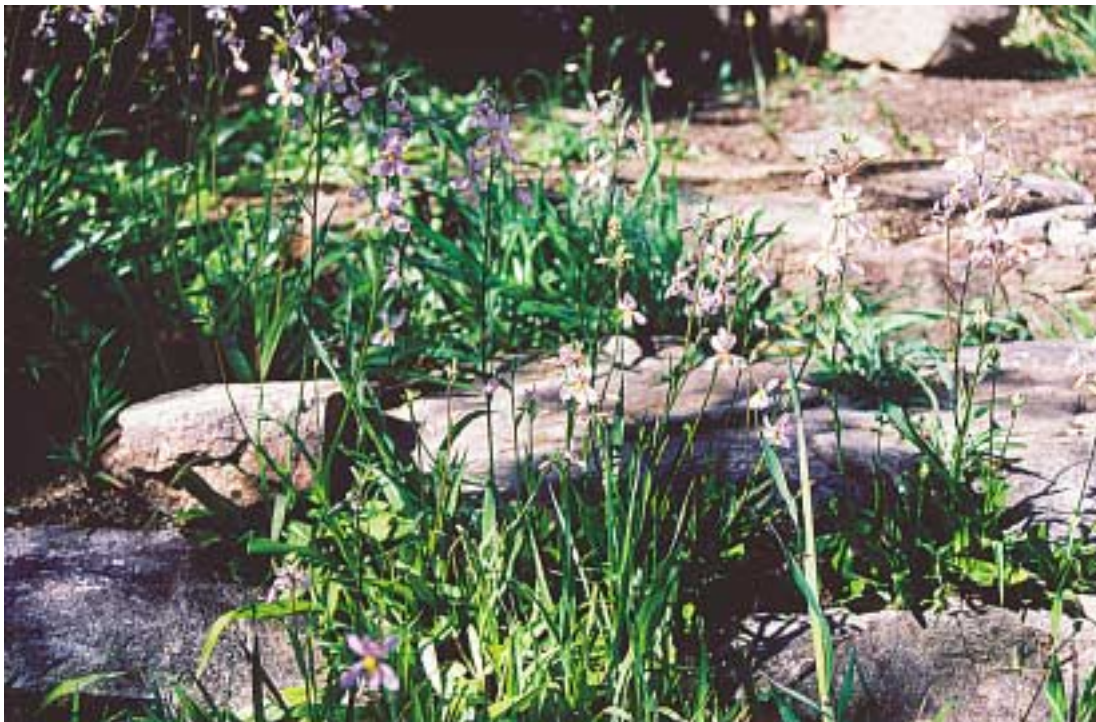
Cyanella orchidiformis (Ramskop Wildflower Reserve)

Als je de tuin op je gemak wilt bekijken, moet je hier minimaal een dag voor uittrekken. Dat lijkt lang, maar er is zo veel te