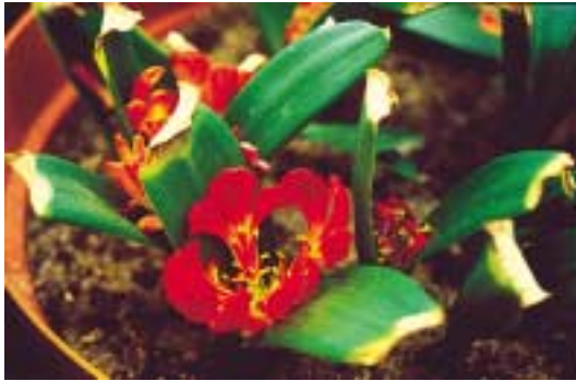
Kirstenbosch Botanical Gardens, Daubenya aurea var. coccinea

de Kaap-regio is wat betreft de flora. Niet voor niets is de Kaap-regio één van de zes 'floral kingdoms' ter wereld.