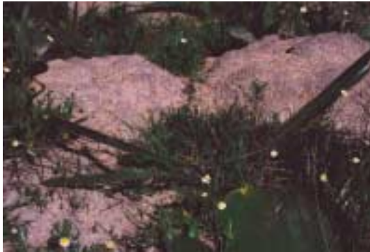
Haemanthus pubescens (Tinie Versveld Wild Flower Reserve)

genkomen: Albuca spiralis , A. unsifolia , Lapeirousia silenoides , Trachyandra falcata , een geelbloeiende en een blauwgroen bloeiende Ferarrria en Babiana , Lachenalia en Haemanthus -soorten, die niet benoemd kunnen worden, omdat er alleen bladeren te zien zijn. Trachyandra falcata komt wijd verspreid voor in West-Kaap. De plant, met name de nog niet uitgelopen bloeiwijzen, worden gegeten en de smaak ervan schijnt overeen te komen met die van asperges.