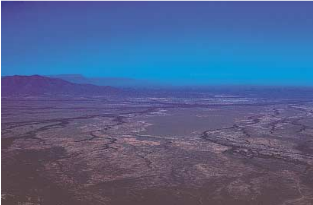
Uitzicht op Knersvlakte vanaf Vanrhijns pas