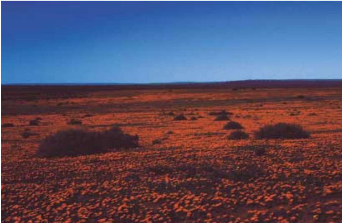
Uitzicht farm Glenlyon met bloeiende Gorteria diffusa

maar langs de kant van de weg te stoppen en in de 3 tot 5 meter brede strook tussen de weg en de afrastering van de weilanden je ogen de kost te geven. Zo kan je een bloeiende Tenicroa filifolia tegenkomen, met direct ernaast een niet-bloeiende Tenicroa multifolia . Van deze laatste plant zijn op het moment, dat we er zijn, alleen de kenmerkende karakteristieke gekrulde of opgerolde bladeren te zien. Je moet goed opletten, dat je niet op het verkeerde been wordt gezet, want er groeien in hetzelfde gebied ook Gethyllis , Albuca en Chlorophytum soorten met vergelijkbare vegetatie. Ook groeien en bloeien er de diverse Bulbine 's. Door de afwezigheid van een deel van de bladeren is het moeilijk te bepalen om welke soorten het gaat. In augustus kan je niet onopgemerkt Brunsvigia bosmaniae passeren. De 4 tot 10 bladeren van de plant liggen plat op het grondoppervlak en kunnen ieder zo'n 30 cm lang worden. De planten bloeien aan het begin van de herfst in maart-april. Je schijnt er de klok op gelijk te kunnen zetten: circa 3 we-