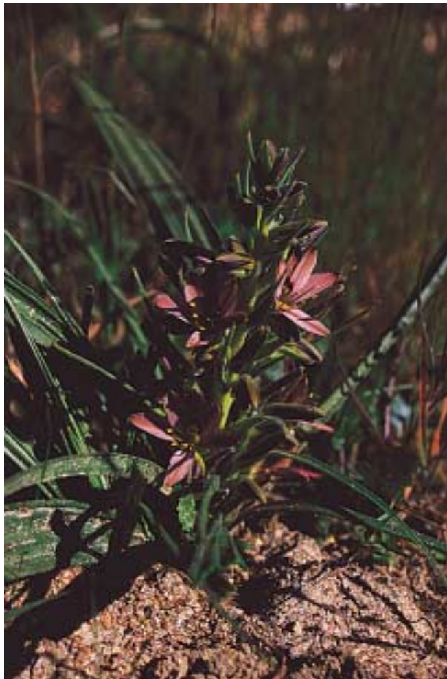
Wachendorfia parviflora (Waylands Farm)