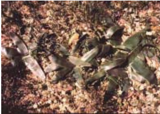
Brunsvigia bosmaniae (omgeving Niewoudtville)